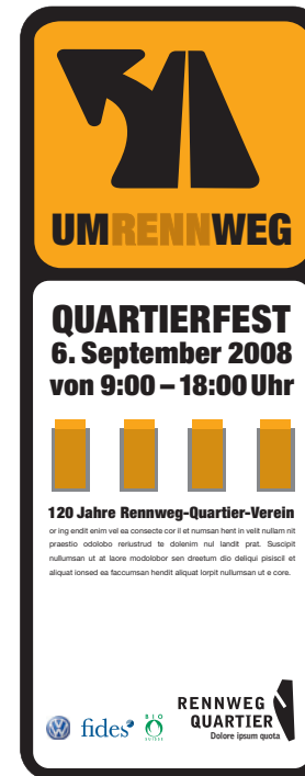
↑ Mögliche Sponsoren-Präsenz auf Infotafel an den Quartiereingängen (Tafel 3x1m)